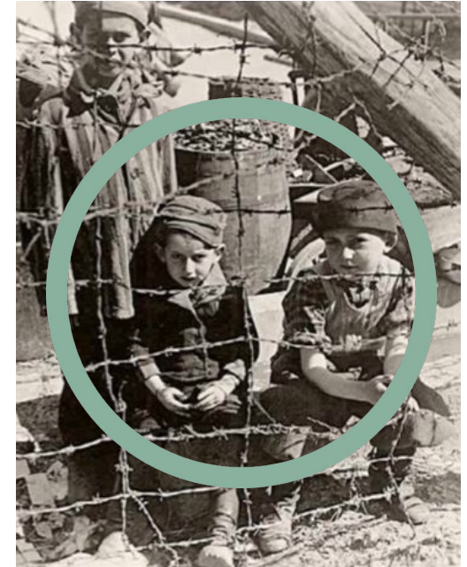
Enfants dans le camp de concentration de Buchenwald, Allemagne, après la fin de la guerre.

En commémorant l'Holocauste, nous prenons conscience de notre responsabilité, en tant que citoyen d'une société démocratique, à nous engager activement pour promouvoir les droits de la personne.